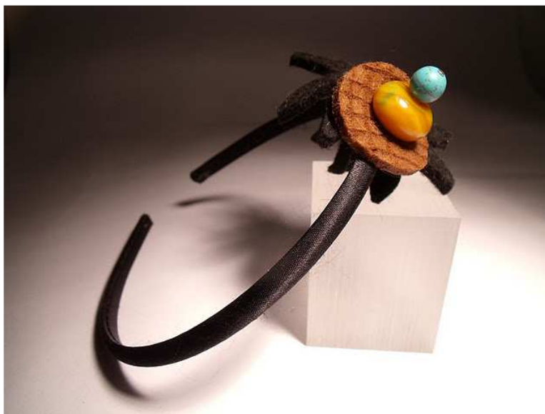
Cerchietto decor di Giulia Sorvillo