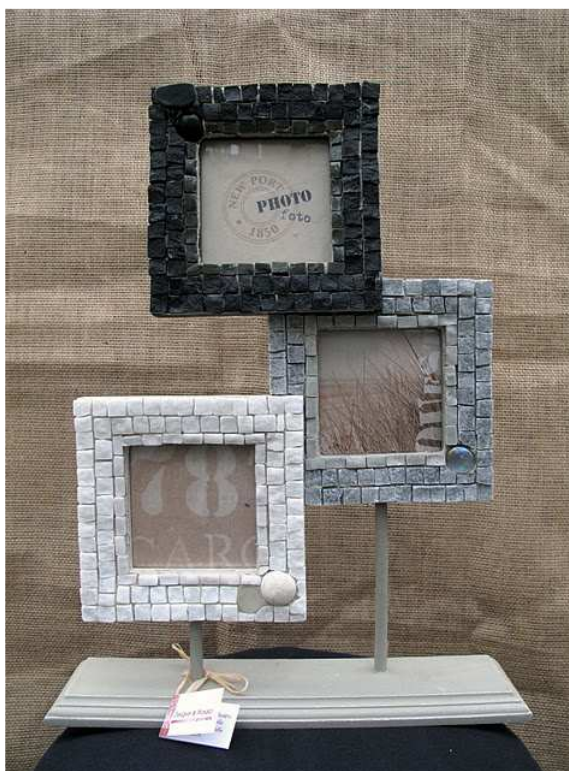
Cornici mosaico di Giorgia Palombi